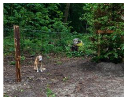
Het IJzeren Gordijn