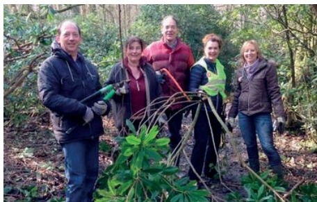
Enkele noeste werkers van het VVWG team voor NLDoet

Op zaterdag 12 maart 2016 hebben een zevental vrijwilligers van onze vereniging groots werk verricht in het kader van NLDoet. Gewapend met spades en snoeitangen hebben ze het pad langs de Rododendronvijver weer begaanbaar gemaakt. Ploeterend door de modder zijn de rododendrons gesnoeid en zijn de bramenstruiken verwijderd. Het resultaat mag er zijn. Een prachtig breed pad en veel licht en ruimte voor de rododendrons. En nu maar hopen dat er veel mooie paarse bloemen komen dit voorjaar. Nogmaals dank aan allen die mee geholpen hebben!