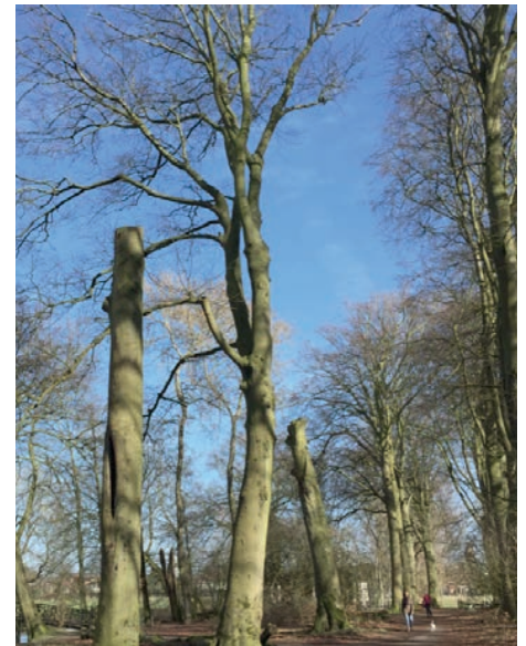
Torenlaan met dode beuken, alleen de stam staat nog overeind om het laanbeeld te behouden

De Torenlaan loopt evenwijdig met de Ritzema Boskade. Vanaf de kant van de Herenweg kun je de toren van de katholieke kerk aan het Valkenburgerplein goed zien. De Torenlaan bestaat uit beuken en linden. De linden bij de entree aan de Herenweg zijn in goede staat, maar veel van de beuken zijn dood. Van veel bomen staat alleen de stam nog overeind; ze waren nog niet gekapt om het beeld een laan langer te behouden. De gemeente is voornemens om de beuken in het najaar 2017 in één keer te vervangen voor nieuwe beuken. Het is nodig om ook de nog gezonde bomen te kappen om licht te maken, zodat de nieuwe beuken mooi gelijk op kunnen groeien.