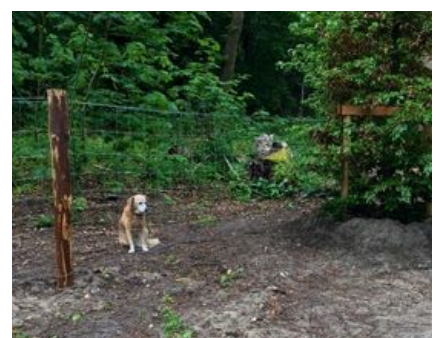
Het IJzeren Gordijn