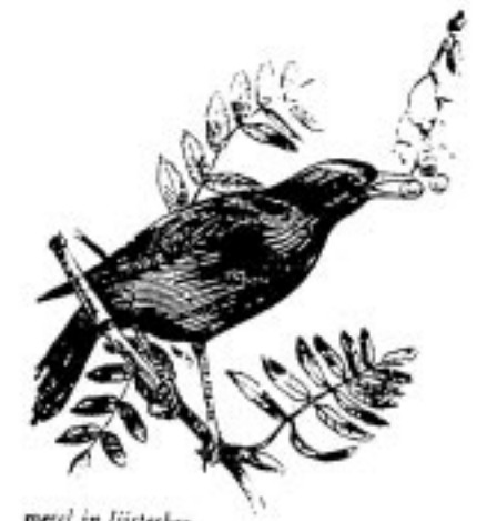
merul in lijsterbes