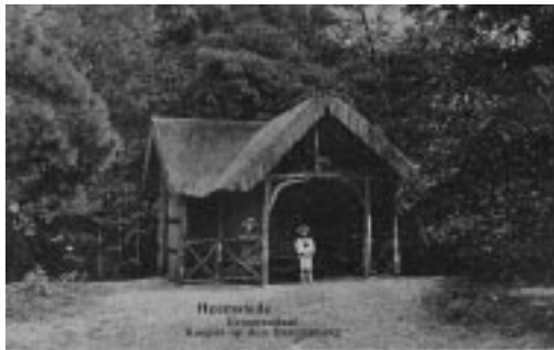
een oude foto van het eerdere huisje

3. U staat nu voor het Heksenhuisje. De naam zou in de jaren 1950 zijn bedacht door de boswachters. Het is van oorsprong een schuilhut, voor onverwacht slecht weer. Een eerder model